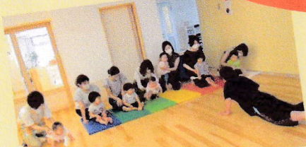
からだをうごかそう！