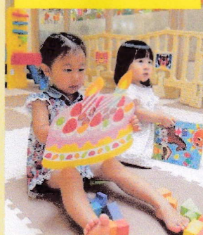
おたんじょうび おめでとう！