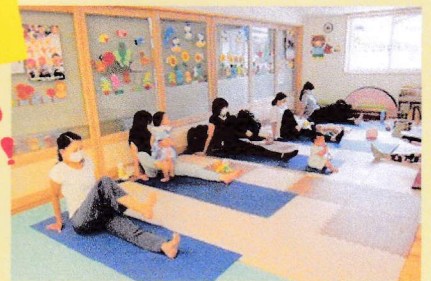
おかあさんの リフレッシュ！