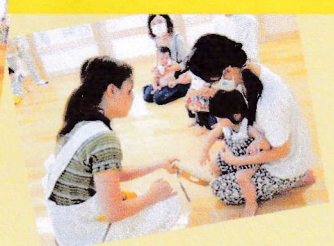
「親子リトミック教室」